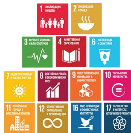
Рис. 3 – Вклад акселератора 2 в достижение ЦУР

Реализация мероприятий регионального акселератора «SMART-управление развитием или цифровизация процессов развития» внесут вклад в достижение ЦУР 1, 2, 3, 4, 6, 7, 8, 9, 10, 11, 12, 16, 17 (рис. 3).