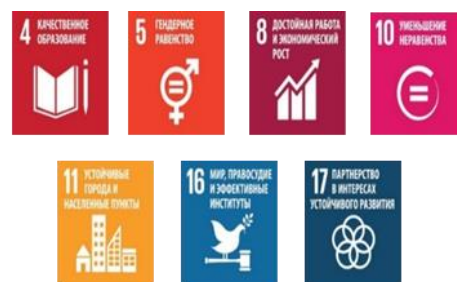
Рис. 5 – Вклад акселератора 4 в достижение ЦУР

Реализация мероприятий регионального акселератора «Вовлеченное управление региональным развитием» соответствует рекомендациям миссии MAPS для достижения целей ЦУР в Республике Беларусь и внесет вклад в достижение всех 17 ЦУР, в наибольшей степени 4, 5, 8, 10, 11, 16, 17 (рис. 5).