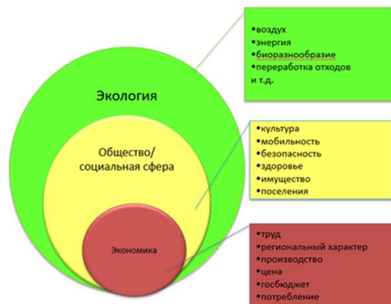
Рис. 1 – Модель сильной устойчивости развития

Видение будущего развития Могилевской области к 2035 г. представлено в соответствии с моделью развития на основе сильной устойчивости (рис. 1). В основе устойчивости развития – экологическая ситуация региона, благоприятная для жизнедеятельности и развития жителей области. Экономика области является эффективным инструментом для сохранения экологии и развития человека в гармонии с природой.