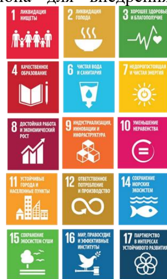
Рис. 4 – Вклад акселератора 3 в достижение ЦУР

Реализация мероприятий регионального акселератора «Территориально-ориентированное развитие и межсекторная кооперация» внесут вклад в достижение ЦУР (рис. 4).