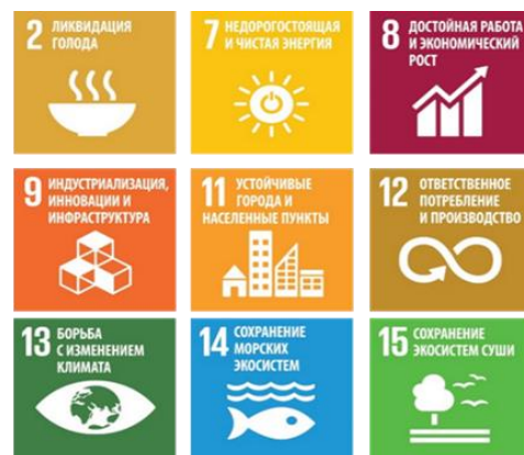
Рис. 2 – Вклад акселератора 1 в достижение ЦУР

Реализация мероприятий регионального акселератора «Экологизация регионального развития» внесет вклад в достижение следующих ЦУР: 2, 7, 8, 9, 11, 12, 13, 14, 16 (рис. 2).