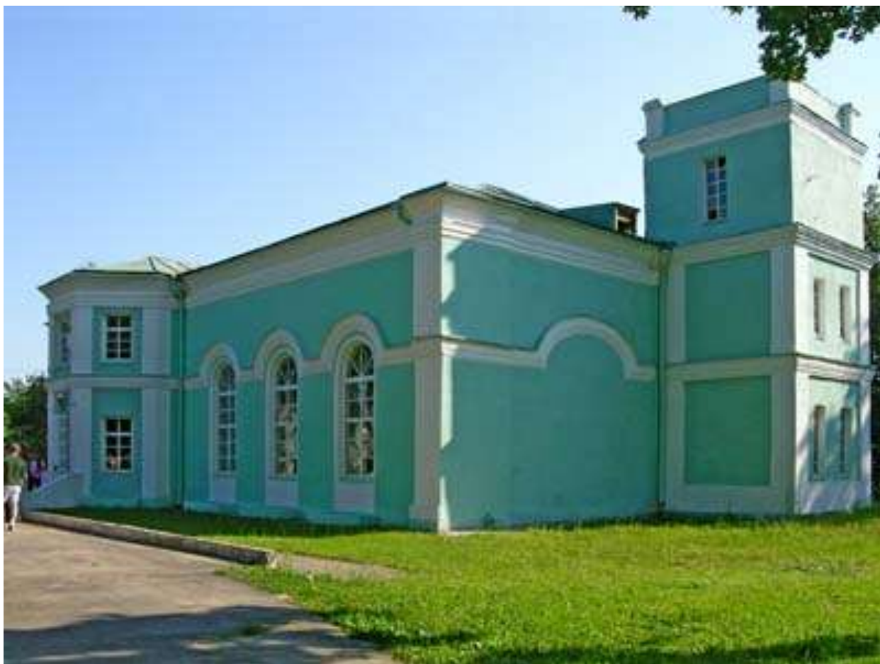
Усадьба дворян Жуковских. Построена в XIX веке.

С начала реализации проекта выполнены работы по благоустройству и озеленению агрогородка.