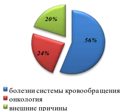
Показатели общей смертности, 2023 год