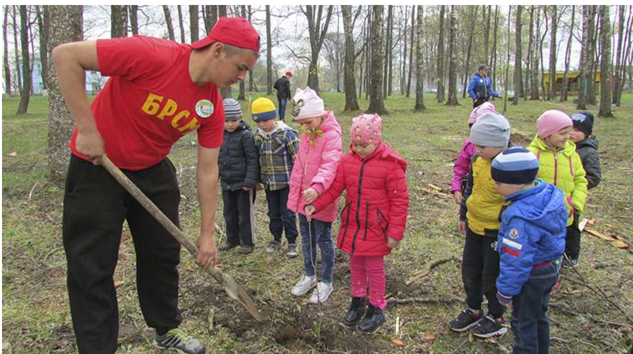
Мероприятие по благоустройству присадебного парка.